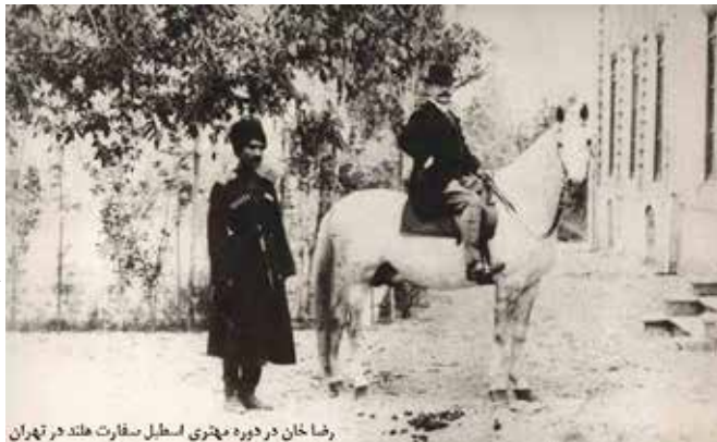
رضا خان در دوره مهنری اسطبل سفارت هلند در تهران

از مشروطه خواهان و مبارزان به صورت خودجوش در کرمانشاه، تبریز، گیلان و خراسان به این وضعیت واکنش نشان داده و دست به مقاومت های سیاسی و نظامی علیه انگلستان و روسیه و مجریان داخلی آن ها زدند که معروف ترین آن ها قیام شیخ محمد خیابانی در تبریز (فروردین تا شهریور ۱۲۹۹) و جنبش میرزا کوچک خان در گیلان (۱۳۰۰-۱۲۹۹) بود. در سال ۱۹۱۷ در روسیه امپراتوری تزار طی دو انقلاب فوریه و اکتبر سرنگون شد. سقوط امپریالیسم روس و روی کار آمدن یک دولت انقلابی سوسیالیستی در روسیه، بر سیاست و جامعه ایران تأثیرات عمیقی گذاشت. دولت تازه تأسیس شوروی، کلیه معاهدات استعماری میان روسیه تزاری و ایران را لغو کرد و پیروزی انقلاب بلشویکی باعث خیزش جنبش های انقلابی و سوسیالیستی در نقاط مختلف جهان از جمله ایران شد. میرزا کوچک خان که جنبشش تا پیش از این ماهیتی ضد استعماری، رفرمیستی و مشروطه خواهانه داشت با انقلابیون چپگرای ایران متحد شد و به یک جنبش انقلابی، ضد امپریالیستی و سوسیالیستی تبدیل شد. اتحاد جنگلی ها و کمونیست های ایرانی در خرداد ۱۲۹۹ با حمایت و کمک های مستقیم دولت تازه تأسیس شوروی، جمهوری شورایی سوسیالیستی ایران را اعلام کردند.